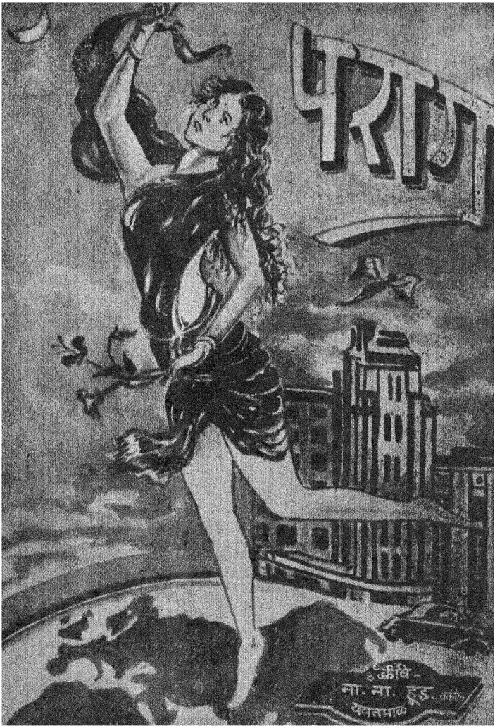
कुलवेडी पान १.